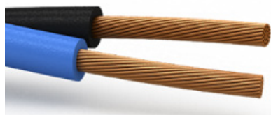
Подходят для многожильных проводников